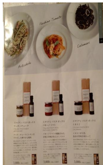
Generics διαφημιστική καταχώρηση ιταλικού ελαιολάδου σε συνδυασμό με σάλτσα, σπαγγέτι και συνταγές