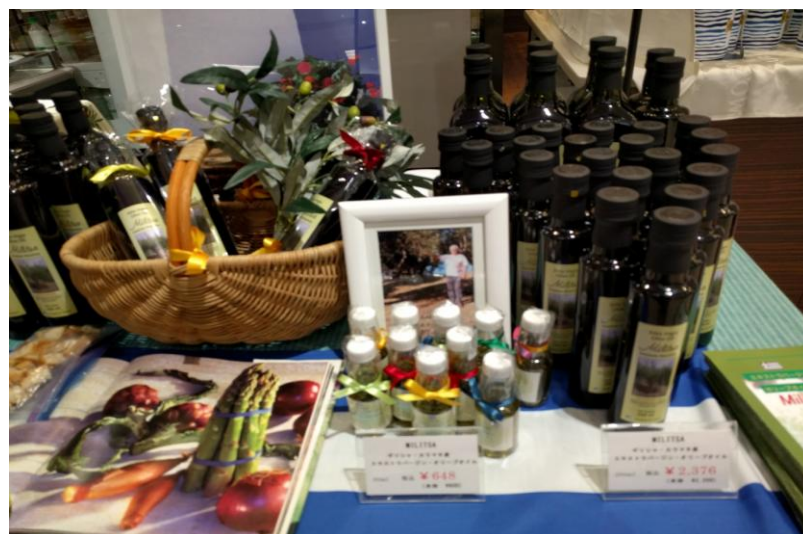
Γευσιγνωσία ελληνικού ελαιολάδου Militsa στο σούπερ μάρκετ PRECCE, 19/6/2017