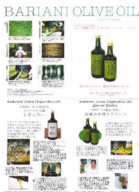
Flyer explaining harvest, production, extraction process