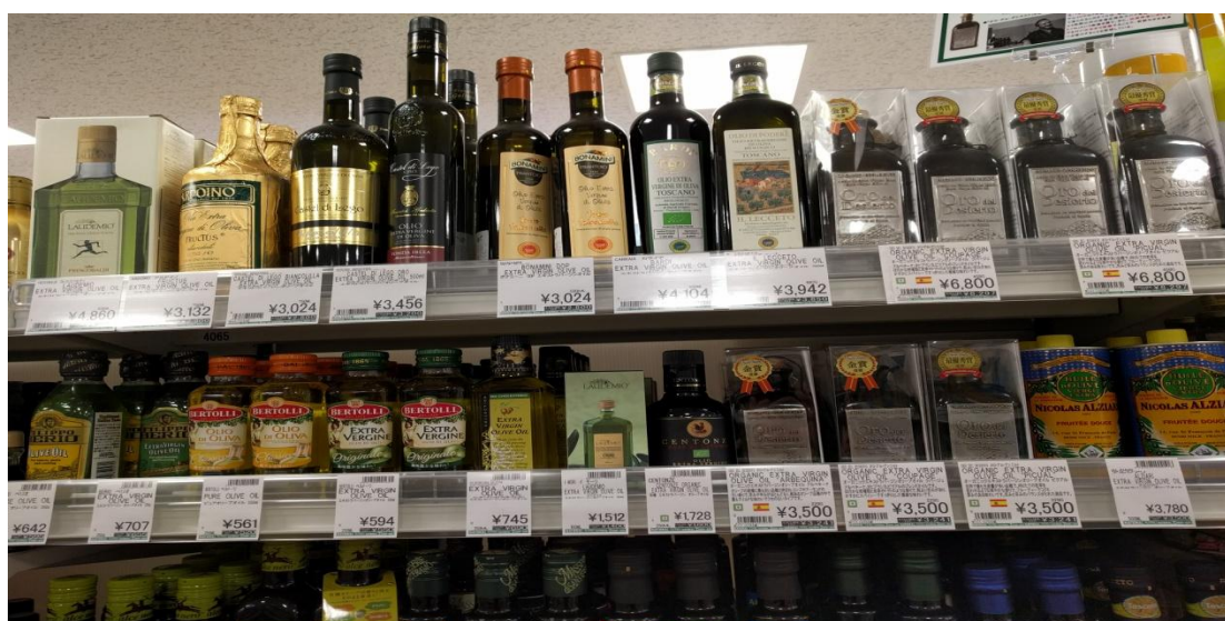
Ελαιόλαδα σούπερ μάρκετ National Azabu, 19/6/2017