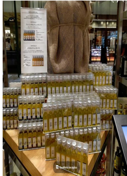
Προώθηση ελαιολάδου 10 ml σε συσκευασία των 6 στο delicatessen Dean & Deluca