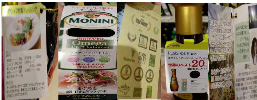
Πρόσθετες πληροφορίες στην ετικέτα (συνταγές, ωφέλη στην υγεία,