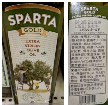
Ελαιόλαδο SPARTA GOLD, έξτρα παρθένο, 500ml, 1296 γεν, σούπερμάρκετ PRECCE, 19/6/2019.