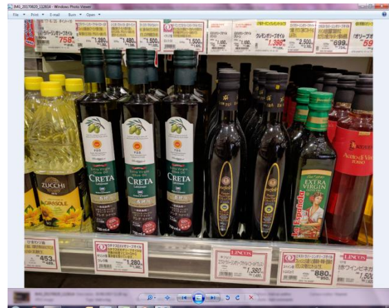
Ελαιόλαδο CRETA LATZIMAS, έξτρα παρθένο, 750γρ., 1382 γεν, ελαιόλαδο NEFELI, , έξτρα παρθένο 458 γρ., 1490 γεν, Σούπερ Μάρκετ Lincos, 19/6/2017.