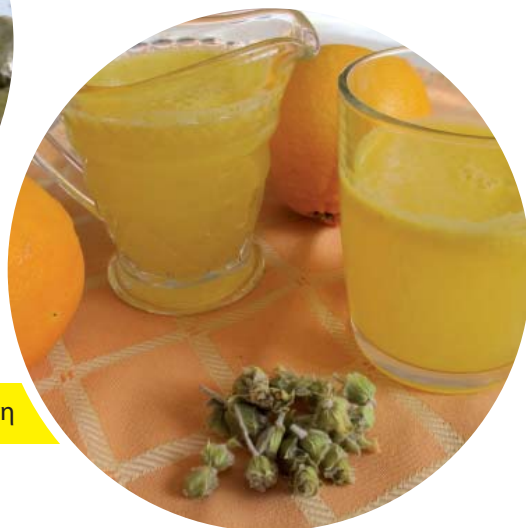
Δροσερός χυμός σιδερίτη