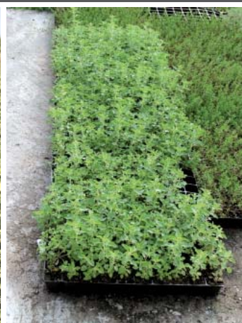
Πολλαπλασιαστικό υλικό ρίγανης