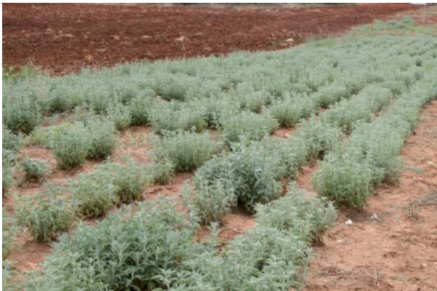
Καλλιέργεια ελληνικού φασκόμηλου Salvia fruticosa