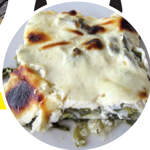
Σπανάκια φούρνου με γιαούρτι μέντα