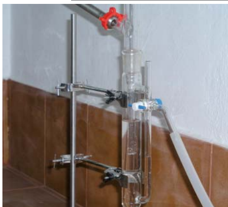
Διαχωριστής αιθέριου ελαίου μικρού βιοτεχνικού αποστακτήρα