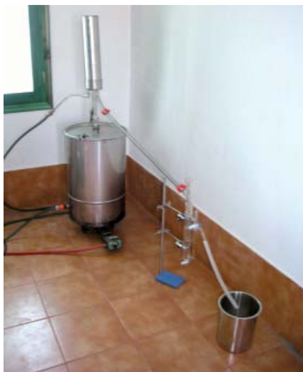
Απόσταξη άνθους λεβάντας σε μικρό βιοτεχνικό αποστακτήρα