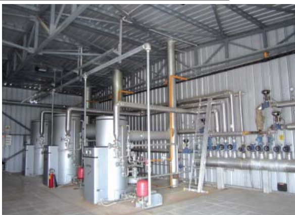
Βιομηχανικοί ατμολέβητες για απόσταξη αιθέριου ελαίου