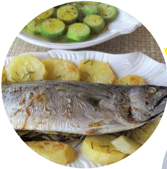
Παλαμίδα με πατάτες, δεντρολίβανο