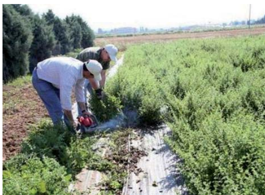
Συλλογή μελισσόχορτου με το χέρι